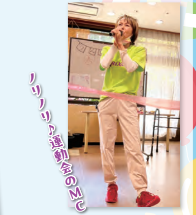
リフレック運動会のMC