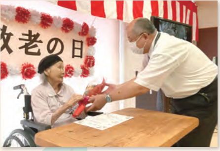
敬老会で節目の方の表彰を行いました。おめでとうございます。