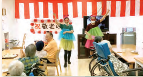
皆様と一緒にカラオケで懐かしの歌謡曲を唄い、職員による余興のダンスを披露して敬老の日をお祝いしました。