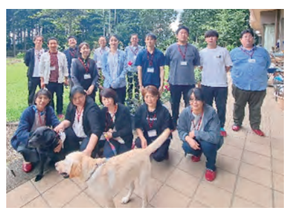
研修を終えて記念撮影

法人内での他施設同士の研修や交流は非常に貴重で新鮮です。最初は緊張していた皆さんも終わりごろにはすっかり打ち解けていました。今後とも十字の園のサービスを待っている皆さんに、より良いサービスを提供する為の力を発揮できる様、心から応援していきたいと思えます。