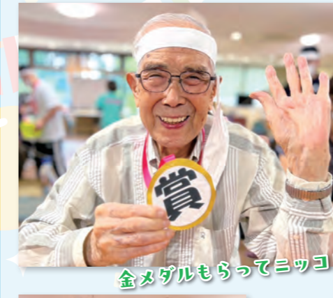
金メダルもらってニコニコ