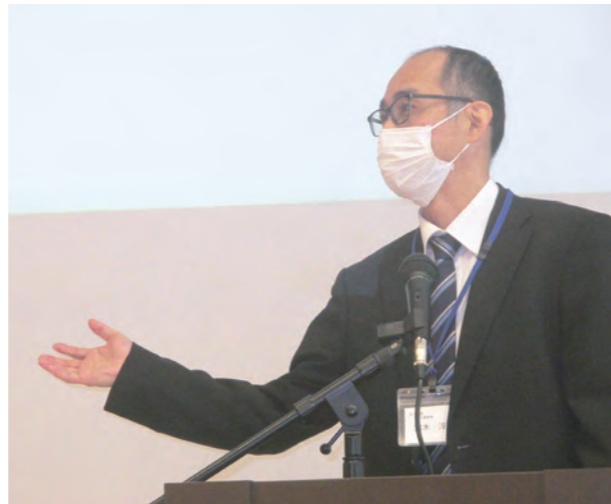
理事長メッセージ

今回の大会で新たに生まれた繋がりや発想、共感し合えた考えを大切にして、職員一人一人が未来に向かって歩いていけたらと思います。