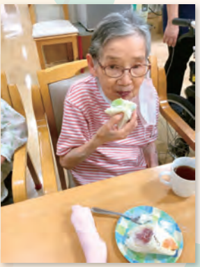
職員手作りの生クリームと果物たっぷりのフルーツサンドは皆様「おいしい」と笑顔が見られ、次々手が伸びており、喜んで下さいました。