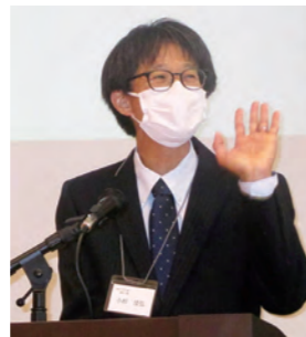
実行委員長の挨拶