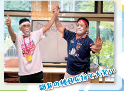
職員の種類応援で大変!!