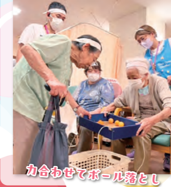
カ合わせてボール落とし