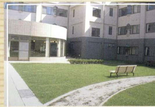
中庭よりケアハウスを臨む