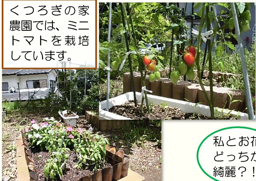
くつろぎの家 農園では、ミニ トマトを栽培 しています。