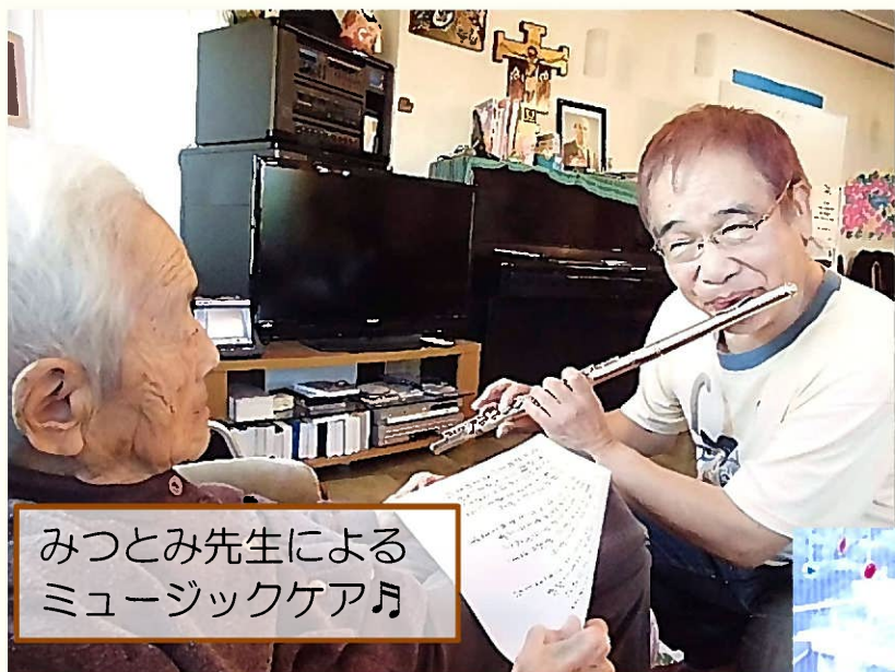
みつとみ先生による ミュージックケア月