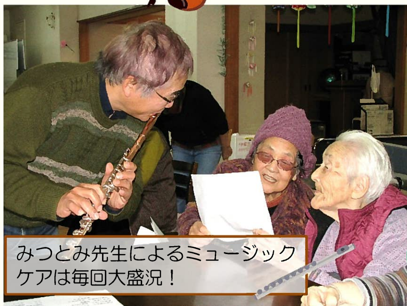
みつとみ先生によるミュージックケアは毎回大盛況！