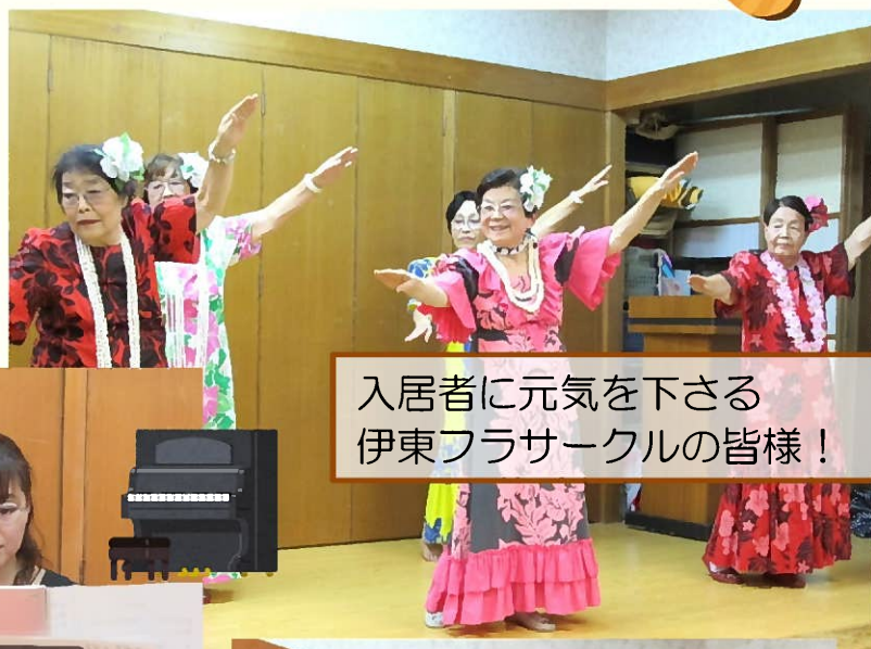
入居者に元気を下さる伊東フラサークルの皆様！