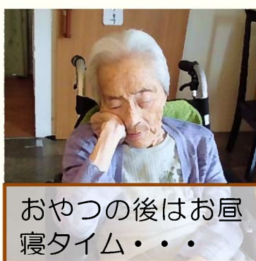
おやつ後はお昼 寝タイム・・・