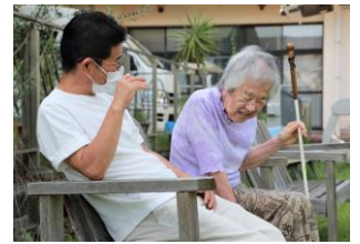
おしゃべりも楽しい・・・