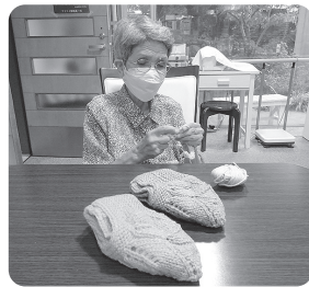
趣味の編み物 楽しんでます

昨年の2月にアドナイ館に入居し、いつまでも元気で過ごせるよう入居後もぷらすワン(トレーニング型デイサービス)や根洗荘に通っています。