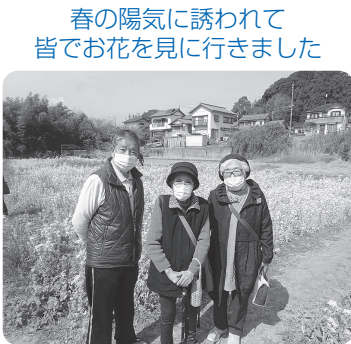
春の陽気に誘われて 皆でお花を見に行きました