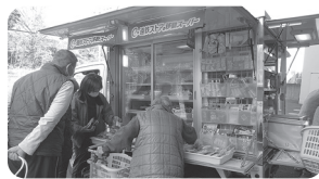
アドナイ館は週1回の訪問でお願いしています。