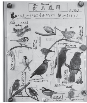
入居者作成の掲示物です