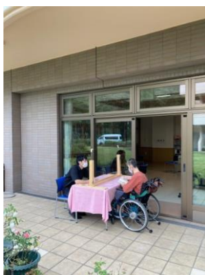
暖かな日はお庭を眺めながら面会