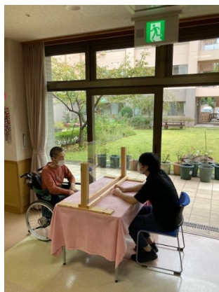
天候や気温によりホールにて行います。